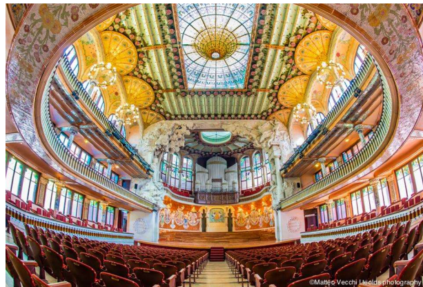
Lluís Domènech i Montaner, Palau de la Música Catalana, 1905-1908