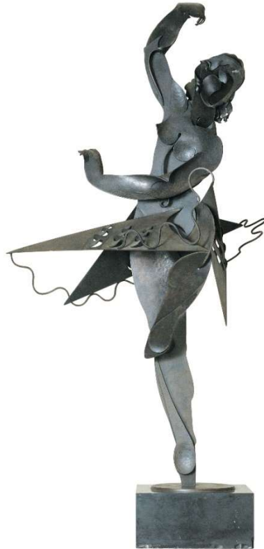
Pau Gargallo, Gran ballarina , 1929

OPCIÓ A. Compara Gran ballarina de Pau Gargallo i Reclining Figure de Henry Moore.