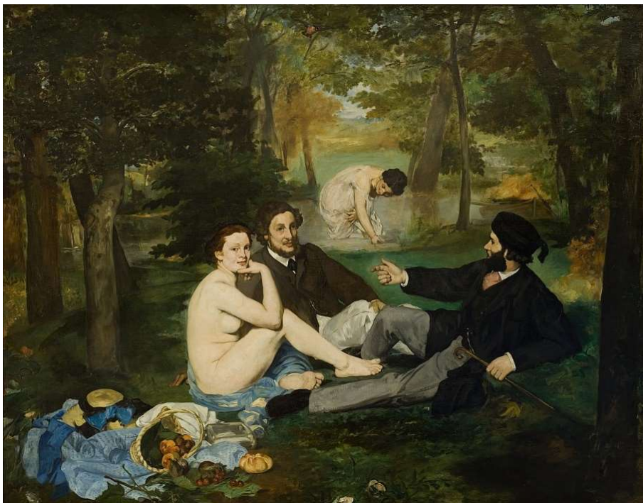
Édouard Manet, El dinar al camp , 1863

Recorda que no has de fer faltes d'ortografia .