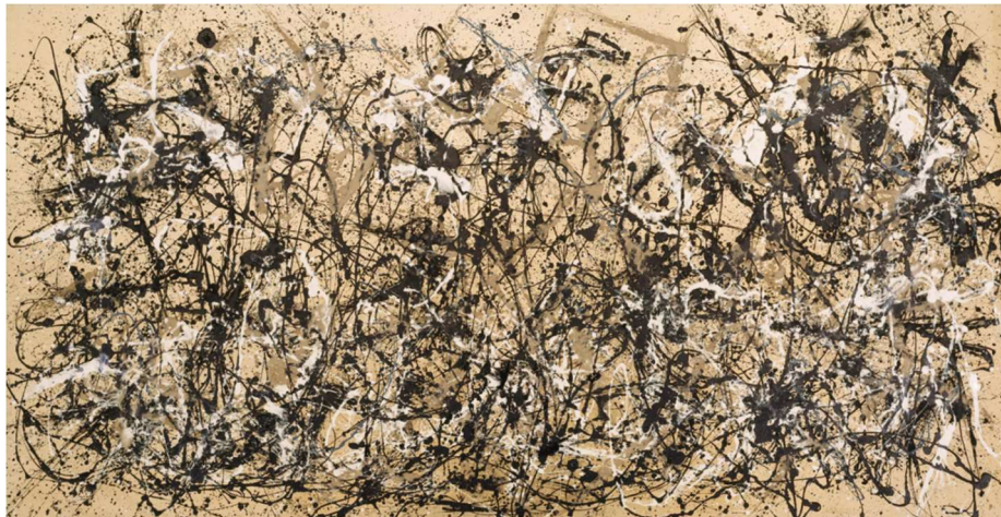
Jackson Pollock, Autumn Rhythm (Number 30) , 1950

Opció A. Del surrealisme a l'expressionisme abstracte. Analitza la influència de l'automatisme (surrealisme) a partir del comentari de l'obra de Pollock Autumn Rhythm (Number 30) .