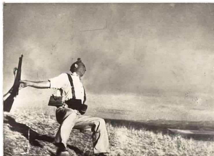
Robert Capa, Mort d'un milicià , 1936