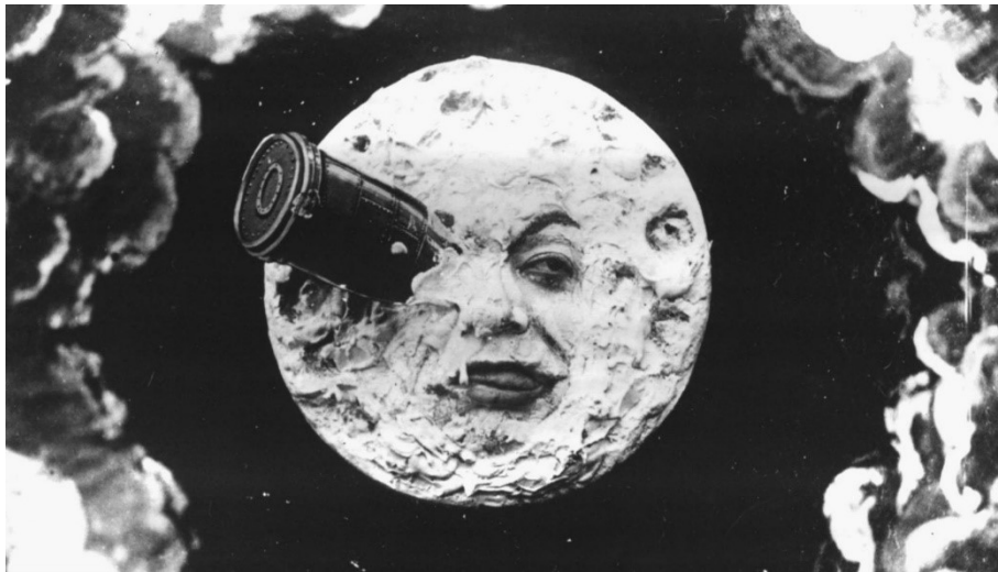
George Méliès, Viatge a la Lluna , 1902