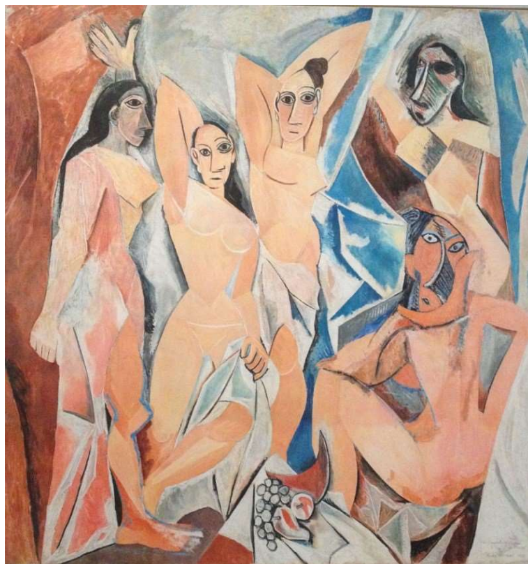
Pablo Picasso, Les demoiselles d'Avignon , 1907