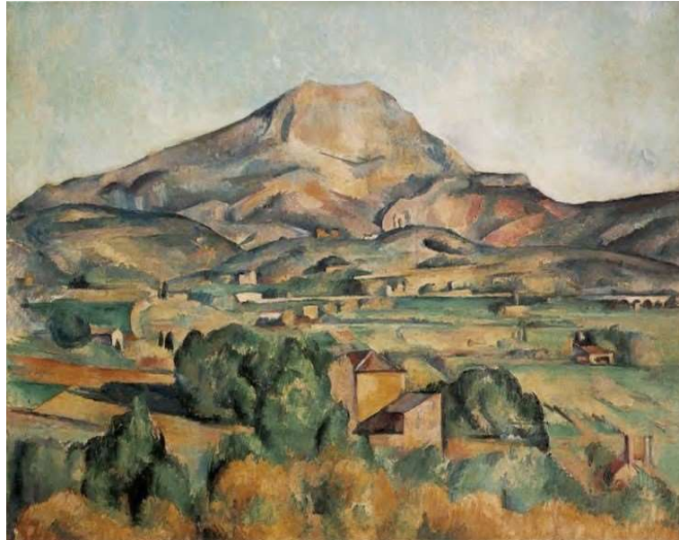
Paul Cézanne, La Montagne Sainte-Victoire , ca. 1885

OPCIÓ B. Relaciona La Montagne Sainte-Victoire de Cézanne i Les demoiselles d'Avignon de Picasso.